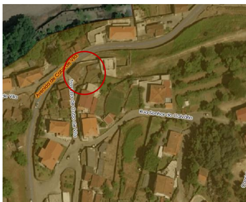
Figura 2 - Extrato Planta de Classificação e Qualificação de Solo RPDM2025